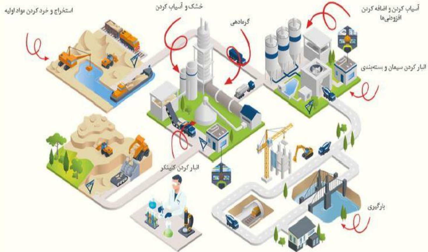
شکل 1- شمتیک تولید سیمان