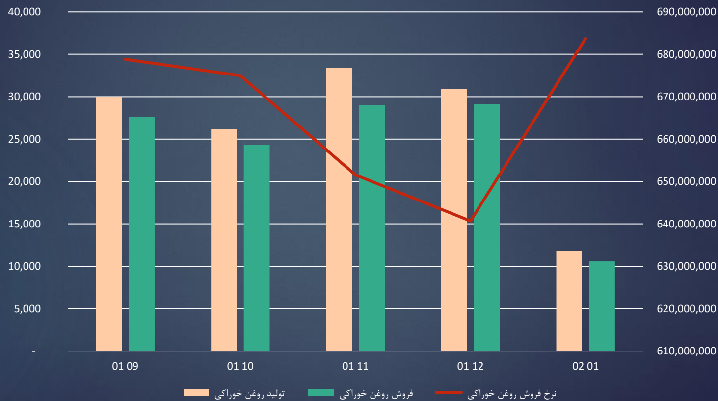
تولید و فروش ماهانه